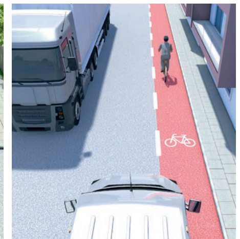
Schutzstreifen für Radfahrer